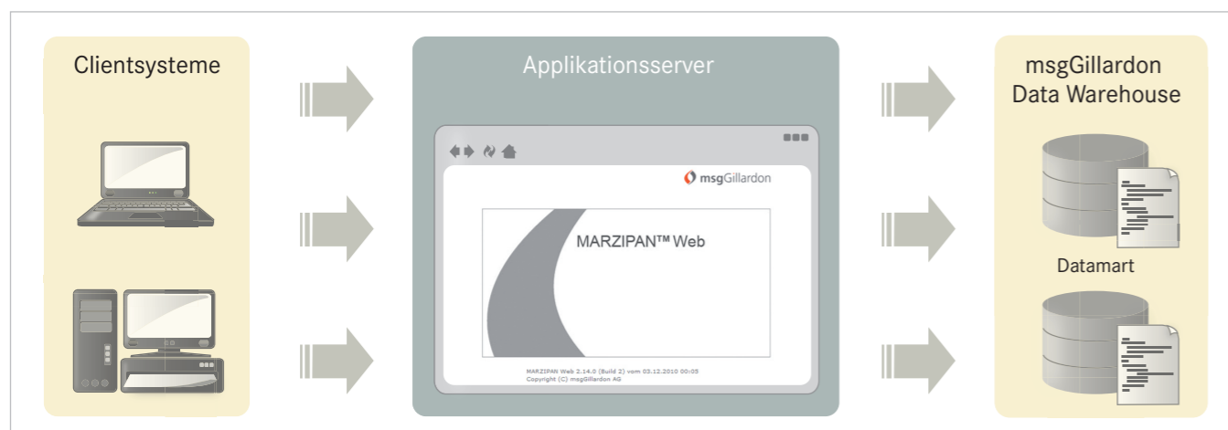
Mit MARZIPAN Web steht Ihnen eine moderne JEE-Applikation zur Verfügung, auf die Ihre Berater über marktgängige Browser von verschiedenen Endgeräten aus zugreifen können.