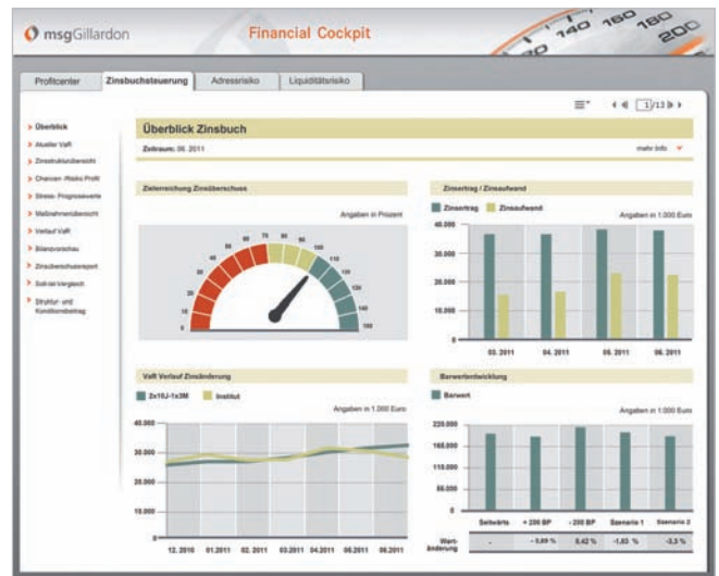
Abbildung 2: Beispielansicht – Überblick Zinsbuchsteuerung